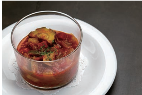
地元野菜入りラタトゥイユ ¥550