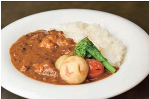
国産牛すじカレー&ライス - 地元野菜添え -