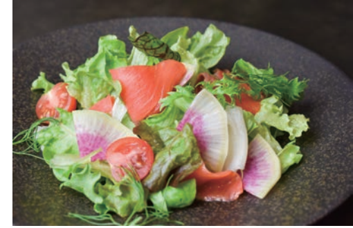
スモークサーモンサラダ ¥1,400 ハーフ ¥700