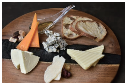
チーズの盛り合わせ ¥900