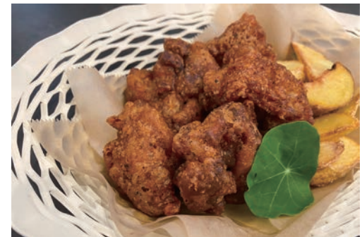
スパイシーチキン&ポテトフライ 3ピース ¥700 5ピース ¥980

*地元の食材をメインに使用しておりますので、 季節により内容が異なる場合がございます。