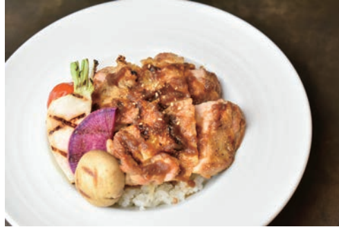
グリルチキン丼 - 地元野菜添え -