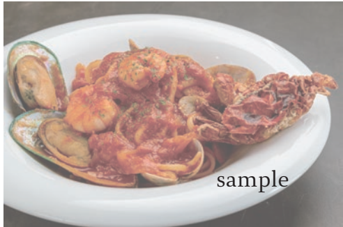
シェフの気まぐれ生パスタ ※卓上黒板をご覧ください