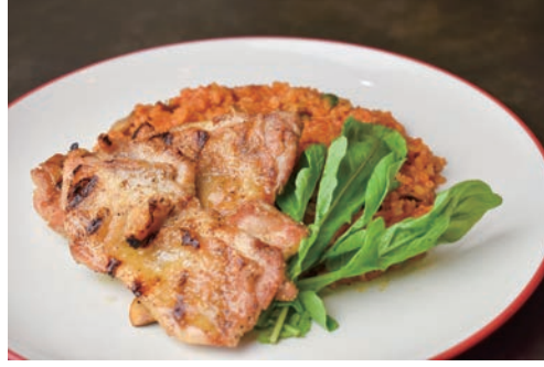
グリルチキンドライカレー