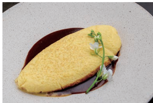
赤座農場純国産鶏の卵 オムレット プレーン ¥550 チーズ入り ¥750 ラタトゥイユ ¥850