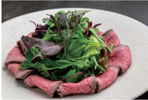
国産牛ローストビーフサラダ ¥1,400 ハーフ ¥700