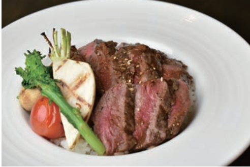
国産ビーフステーキ丼 - 地元野菜添え -