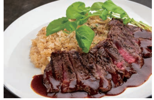
国産ビーフステーキピラフ