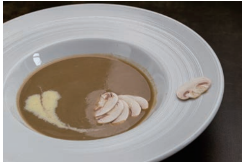
旭産マッシュルームのポタージュ ¥700