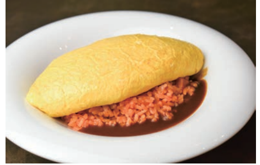
赤座農場 卵のオムライス - デミグラスソース -