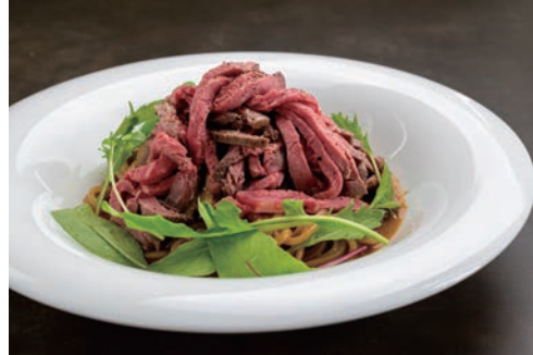
国産ローストビーフと 地元野菜のデミグラスクリーム生パスタ