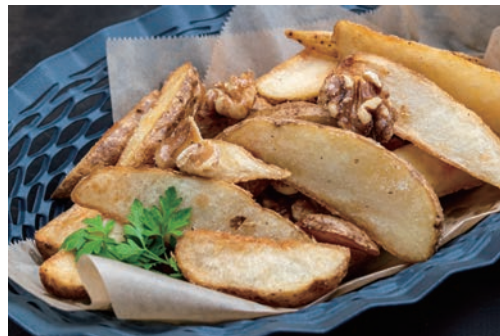
ポテトフライ トリュフ風味 ¥650 塩 ¥550