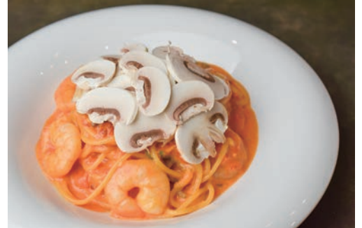
旭産マッシュルームと海老の トマトクリーム生パスタ