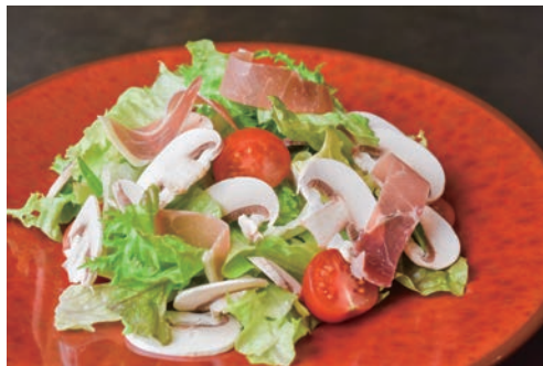
旭産マッシュルームと 生ハムサラダ ¥1,400 ハーフ ¥700