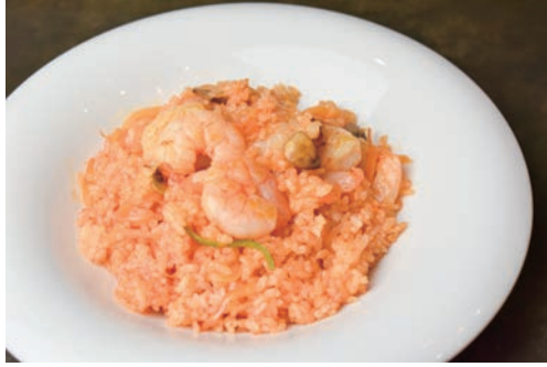
洋食屋の海老ピラフ