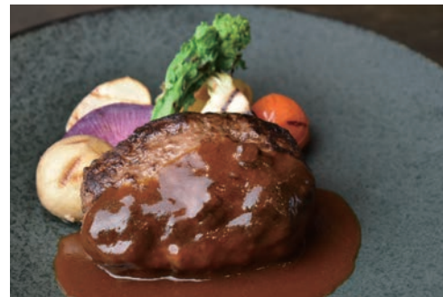
国産牛 100% ハンバーグ