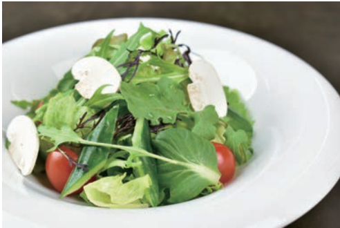
地元野菜のシンプルサラダ ¥700 ハーフ ¥350