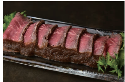
国産牛ローストビーフ - 自家製和風ソース - ¥900